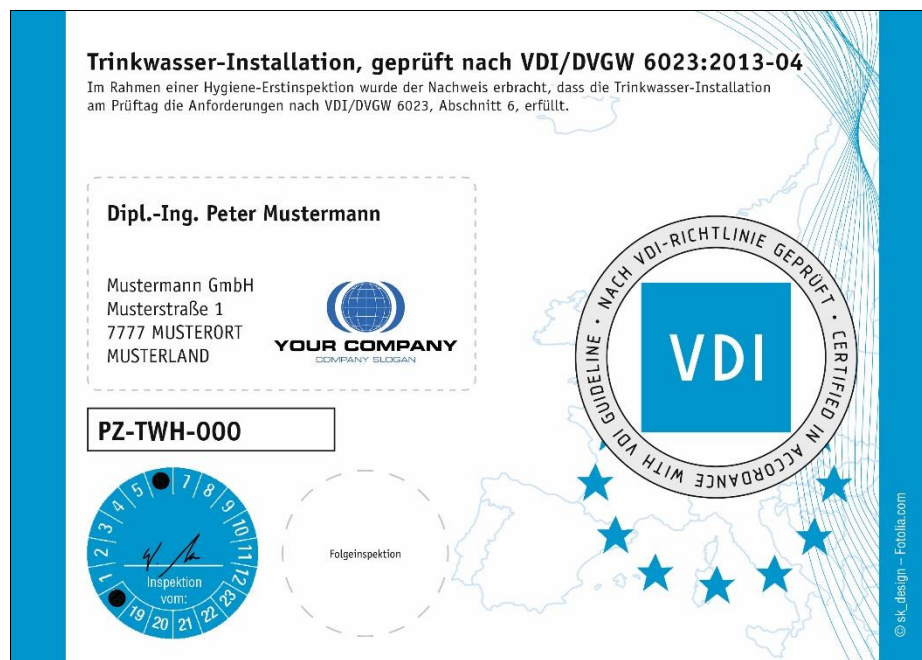
Abbildung 4 Muster-Aufkleber zur Kennzeichnung von Trinkwasser-Installation

Außerdem ist der Zertifikatinhaber berechtigt, bei bestandener Hygiene-Erstinspektion eine entsprechende Prüfbescheinigung mit detaillierter Angabe aller Prüfpunkte auszustellen und das Prüfzeichen des VDI zu vergeben (siehe auch den Hinweis in Abschnitt 3.6). Einen vollständig ausgefüllten Muster-Aufkleber für Trinkwasser-Installationen nach VDI 6023 zeigt Abbildung 4.