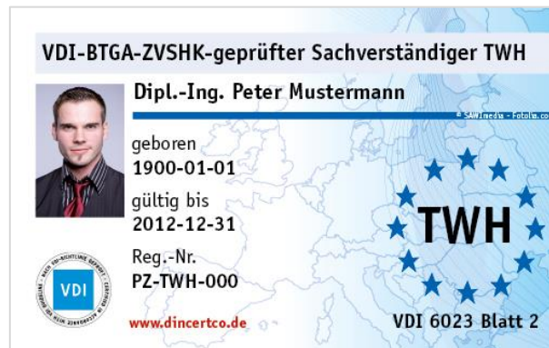
Abbildung 3 Muster-Ausweis zur Dokumentation der Qualifikation vor Ort

Darüber hinaus erhält der Zertifikatinhaber einen begleitenden Ausweis zur Dokumentation seiner Qualifikation vor Ort.