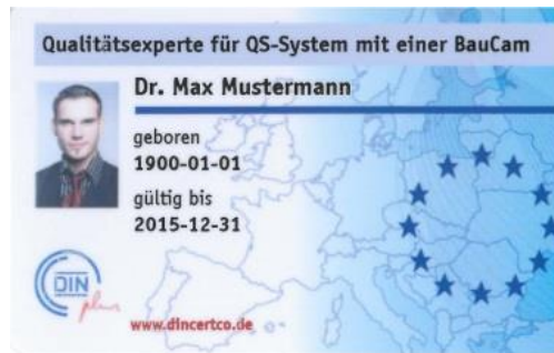
Abbildung 2: Musterausweis

Die Qualitätsprüfer verpflichten sich zu einer ständigen Weiterentwicklung der QM-Datenbank als kontinuierlicher Verbesserungsprozess (KVP) und ihres technischen Kenntnisstandes. Im Rahmen dieser Zertifizierung werden die zuvor beschriebenen Anforderungen an die Qualitätsprüfer überwacht. Bei einer positiven Bewertung erhalten diese Qualitätsprüfer einen DIN CERTCO-Ausweis zur Dokumentation ihrer Qualifikation.