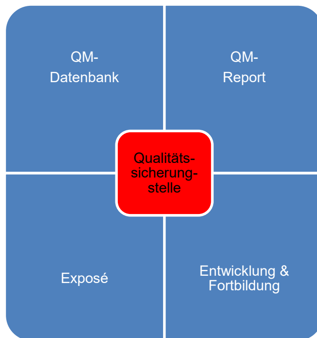
Abbildung 1: Aufgaben einer unabhängigen Qualitätssicherungsstelle

Eine Qualitätssicherungsstelle ist eine unabhängige und eigenständige Gesellschaft, welche im Auftrag von Bauunternehmen oder anderer am Bau Beteiligten die festgelegten Qualitätsziele sicherstellt. Die Qualitätsprüfer der Organisation müssen je nach Einsatzbereich ein abgeschlossenes Studium in der Fachrichtung Bauwesen sowie mindestens 3 Jahre Praxiserfahrungen in der Bauüberwachung besitzen.